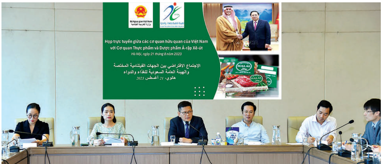
Các đại biểu tham dự cuộc họp tại đầu cầu Hà Nội.

Phía Saudi Arabia nhất trí tăng cường hợp tác trong lĩnh vực tiêu chuẩn đo lường chất lượng; sẵn sàng hỗ trợ đào tạo nguồn nhân lực trong lĩnh vực Halal và giới thiệu các trung tâm chứng nhận Halal uy tín cho các doanh nghiệp Việt Nam có nhu cầu; cho biết sẽ phối hợp chặt chẽ với các cơ quan