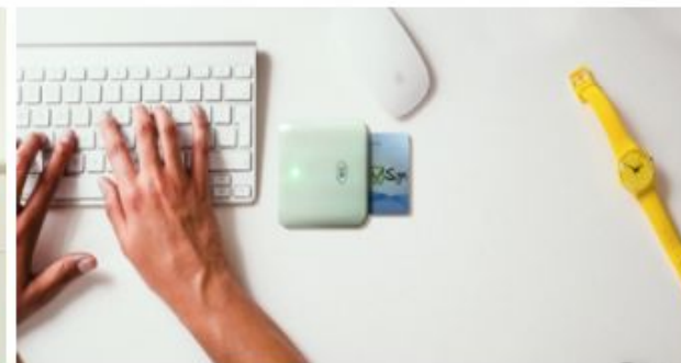
Hướng dẫn sử dụng thẻ chữ ký số