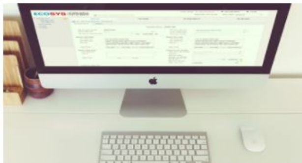
Hướng dẫn khai báo C/O điện tử