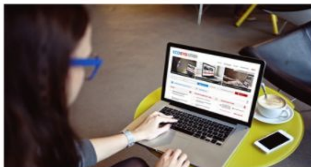
Hướng dẫn đăng ký tham gia hệ thống